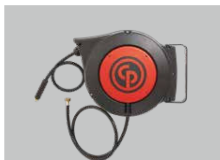
HR8110 Artikelnr.: 8941071992