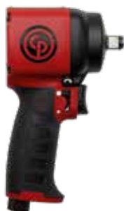
CP7732C Artikelnr.: 8941077321